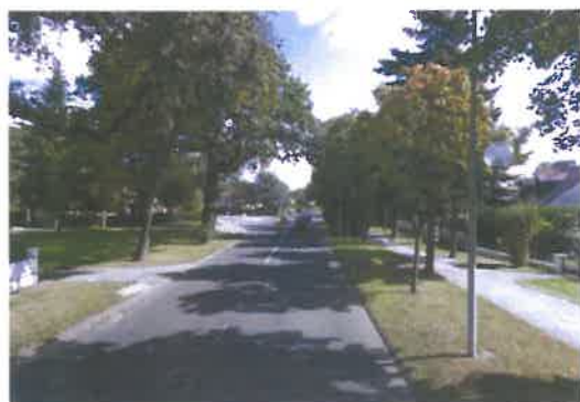
double alignement de l'av. du 11 nov 1918