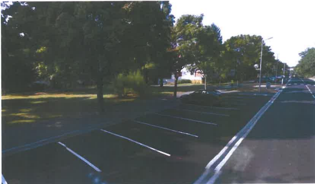
alignement de l'avenue Emile Savigner

Ils réduisent la réflexion de la lumière, offrant en été des espaces reposant pour les yeux. Ils atténuent les bruits de 6 à 8 décibels, soit une sensation de diminution du bruit de 30 à 40%. Ils sont des éléments de continuité biologique (déplacement de la faune).