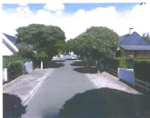
double alignement de l'Avenue de la Grande Pièce

Certains arbres représentatifs de leur espèce sont mis en valeur (plaque signalétique) pour servir de repère et participer à l'éducation des citoyens jeunes et moins jeunes. Ils sont intégrés dans les chemins de randonnée Avrillais.