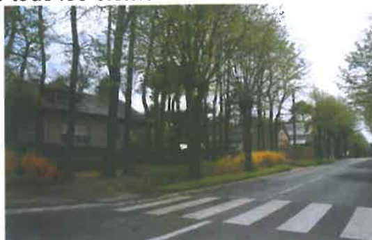
double alignement de Geoffroy Martel

Le choix des essences tient compte également des contraintes locales, la recherche d'essences consommant moins d'eau est privilégiée. Il faut également tenir compte des connaissances en allergologie pour éviter les espèces allergisantes.