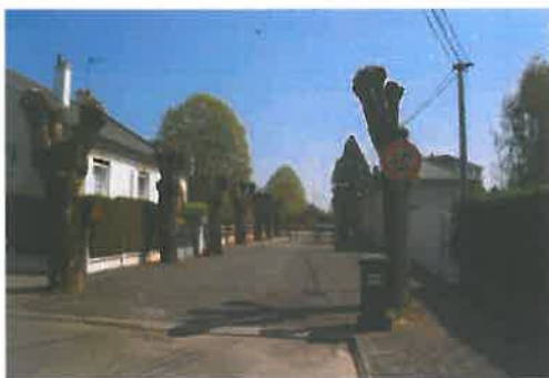
alignement des châtaigniers