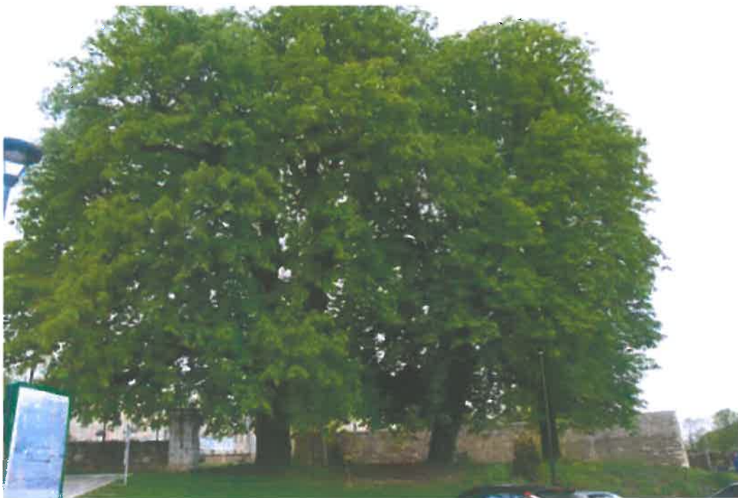
châtaigniers groupés de la Perrière

Quatrième ville du département, Avrillé constitue un véritable poumon vert pour l'agglomération angevine avec cinq parcs, des zones boisées, plus de 4700 arbres d'alignements ou isolés en ville, une ceinture verte qui nous prémunit contre le développement urbain anarchique et des « lanières vertes » (à la Dézière par exemple) lieux de promenade privilégiés.