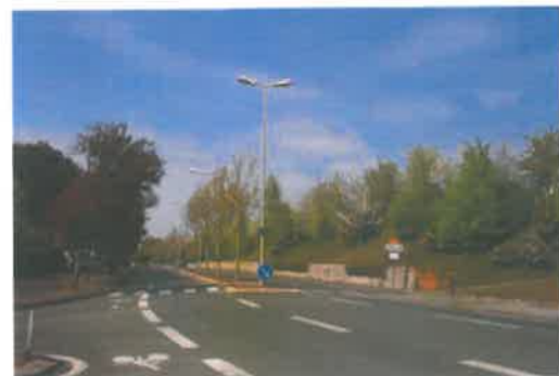
alignement d'arbres à feuillage pourpre

Pour mettre en place une politique arboricole à long terme, un recensement du végétal implanté sur la commune a été engagé depuis plusieurs années. Des règles de choix des essences, de positionnement et de repeuplement sont en cours afin de préserver sur le long terme l'image d'Avrillé ville parc. Cette gestion permet un suivi technique et sanitaire.