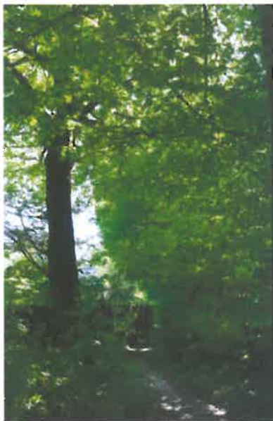
Continuité végétalisée bocagère