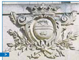
Armoiries des Goddes de Varennes

Certains éléments du système de défense sont encore visibles, notamment une canonnière à rotule. Ce dispositif, équipé d'un obturateur sphérique, sorte de boule mobile percée d'un trou, permettait de tirer de l'intérieur dans de multiples directions et, en cas de danger, d'obturer l'orifice. Sur des façades apparaissent des moellons de tuffeau percés permettant, depuis l'intérieur, de surveiller les entrées du château.