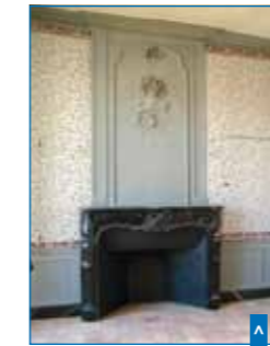
Cheminée après travaux

Les travaux sont réalisés en quasi totalité par des entreprises du Maine-et-Loire dont les principales sont spécialisées dans la restauration du patrimoine.