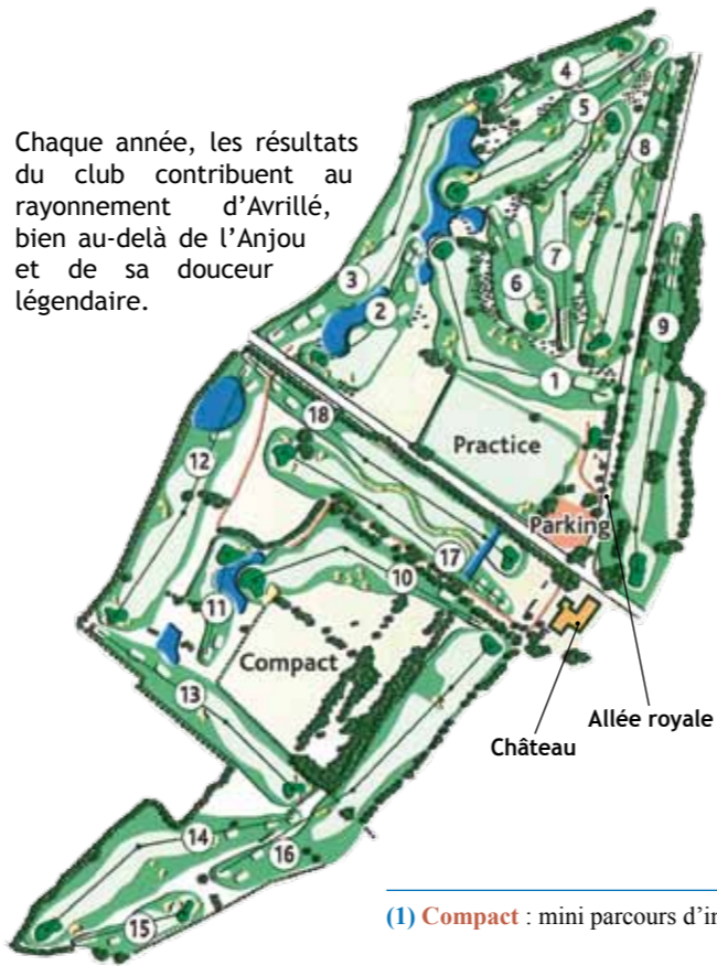
(1) Compact : mini parcours d'initiation - (2) Practice : aire d'entraînement

14 personnes, dont deux enseignants, assurent son fonctionnement. Le club compte 600 adhérents dont de nombreux Avrillais qui bénéficient, par ailleurs, de conditions préférentielles. Certains licenciés et licenciées se sont distingués au plan national.