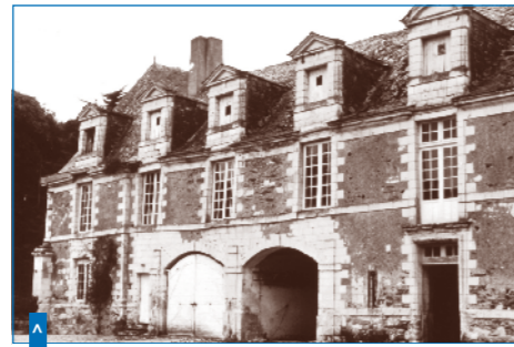
Les communs avant restauration

Certains éléments du système de défense sont encore visibles, notamment une canonnière à rotule. Ce dispositif, équipé d'un obturateur sphérique, sorte de boule mobile percée d'un trou, permettait de tirer de l'intérieur dans de multiples directions et, en cas de danger, d'obturer l'orifice. Sur des façades apparaissent des moellons de tuffeau percés permettant, depuis l'intérieur, de surveiller les entrées du château.