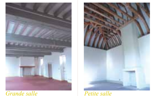
Grande salle Petite salle

LES SALLES À LA DISPOSITION DES AVRILLAIS