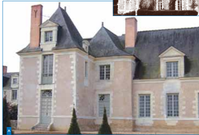
La façade principale, avant et après travaux

Dans cette optique, la Ville d'Avrillé prend l'initiative, en 1981, de créer une Société Anonyme d'Economie Mixte chargée de la restauration et de la gestion du château et de ses dépendances.