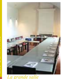
La grande salle