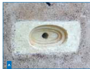
Orifice de surveillance