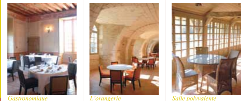
Gastronomique L'orangerie Salle polyvalente