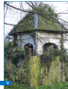
La Gloriette (classée Monument Historique)

Par la branche féminine, le domaine est resté pratiquement dans la même famille de 1603 jusqu'en 1982. Le comte de Saint Pol, dernier occupant, demeura dans les lieux jusqu'en 1989.