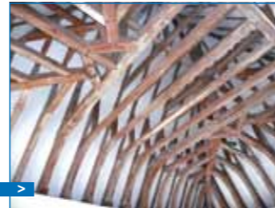
Charpente dans une salle destinée aux Avrillais

Le propriétaire, le comte de Saint Pol, apporte son patrimoine, dont il garde partiellement la jouissance, dans le capital de la société contrôlée majoritairement par la Ville d'Avrillé et auquel participent d'autres acteurs économiques. Cette structure permet en 1982 le début des travaux de mise hors d'eau de l'édifice.